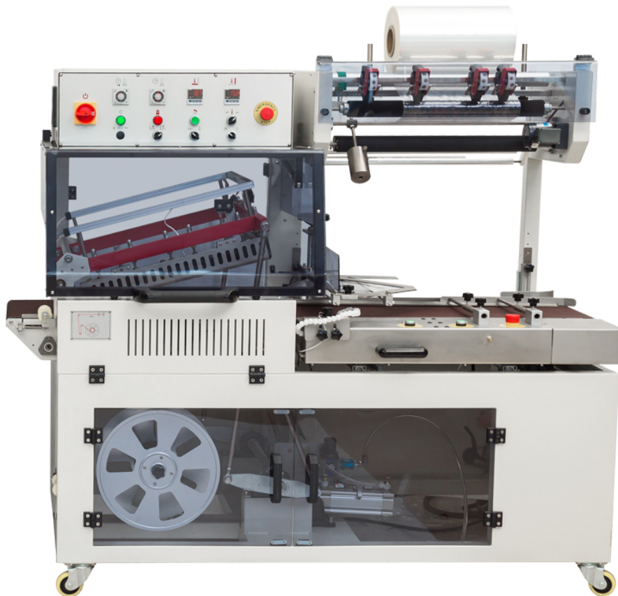
图 1 全自动封切包装机

该指标的设立，对包裹膜热收缩效果进行了精准把控，能保证包装膜在热收缩后的外观质量，确保包装外观的光滑、美观，是下游客户对质量控制的关键环节，配套智能化、自动化，并确保连续性生产，对产品高端领域应用做到了先驱。