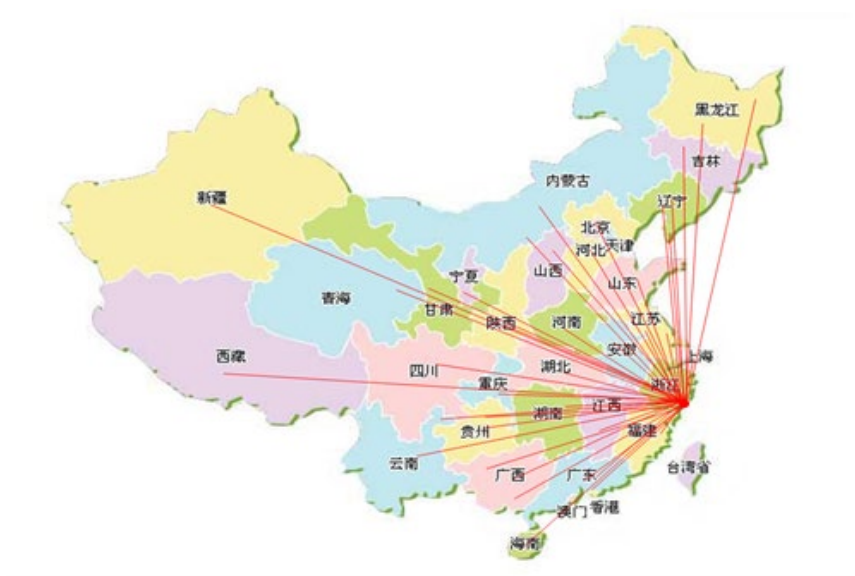
图 3 国内销售网络分布图

厉勇先生嗅觉到“电商”发展带来的商机，从 2012 年开始就着手为电商销售模式铺路，期间也经历过喜与悲，伤和痛，尤其是机械行业根本就没有参照的模式，经过 2019 年销售额达到人民币 13717 万元，确保了这几年每年 20%以上的销售额增长。