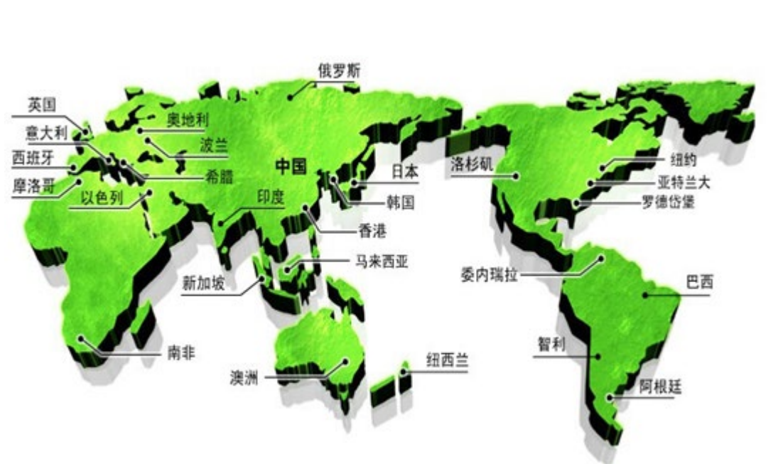
图 4 公司顾客遍布全球